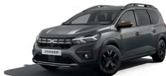
ŠEDÁ SCHISTE (1)