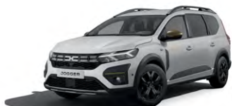
BÍLÁ GLACIER (2)

* Mapové podklady pro střední a východní Evropu, 6 aktualizací po dobu 3 let.