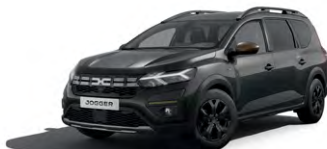
ČERNÁ NACRÉ (1)