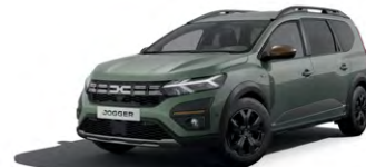
ZELENÁ DUSTY (2)