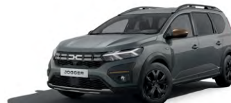
ŠEDÁ URBAN (2)