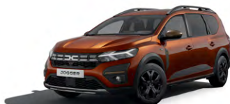
HNĚDÁ TERRACOTTA (1)