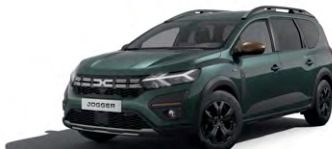
ZELENÁ ČĚDRE (1)